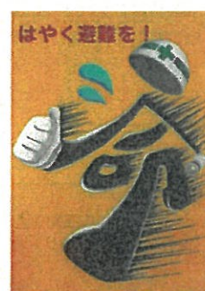
高校生・一般の部