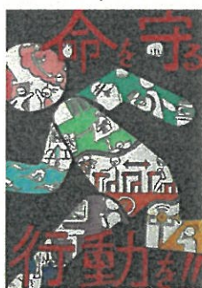
小学6年生・中学1年生の部